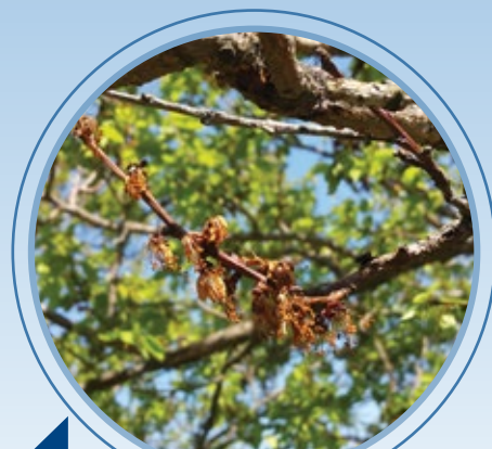
Monilioze cveta koštičavih voćaka

Temperatura > 10°C, vlaženje duže od 24h